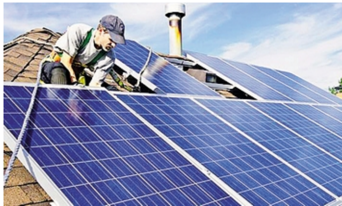
Anche il tema dell'energia è al centro delle iniziative

La prima opportunità è quella di osservare e immortalare fenomeni della natura, interpretare la trasformazione energetica, mettersi in gioco con la Macchina di Turing. «Ci sono tanti modi per valorizzare il meritato riposo dei mesi estivi; il tutto senza spendere un euro, solo con lo sguardo curioso e un po' di inventiva. La Fast-Federazione delle associazioni scientifiche e tecniche (www.fast.mi.it) suggerisce come stimolare la creatività; a cominciare dai due concorsi per spiegare la scienza e la transizione energetica con la fotografia» spiega il presidente Roberto