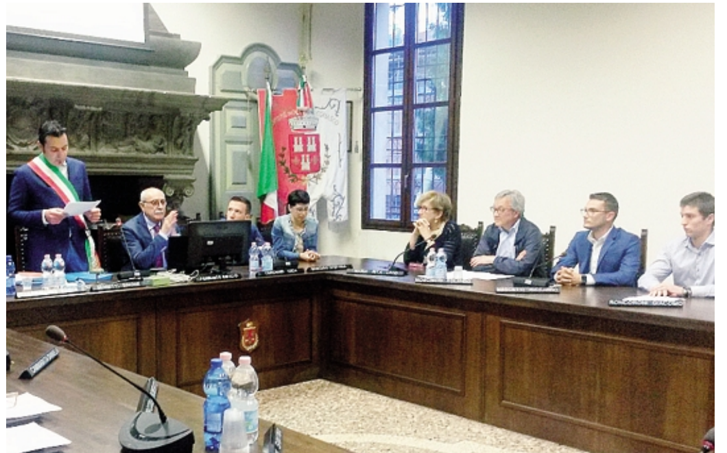
Cinque anni fa l'insediamento del consiglio comunale