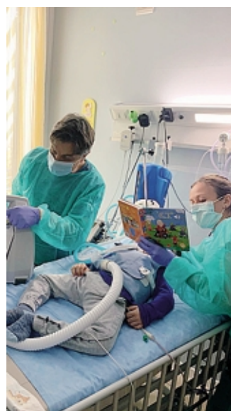
La casa di Gabri

particolare: una parte del ricavato degli acquisti sarà devoluto direttamente ad Agorà '97, la Cooperativa Sociale che favorisce, anche attraverso Casa di Gabri, la promozione umana e l'integrazione di persone che hanno bisogno.